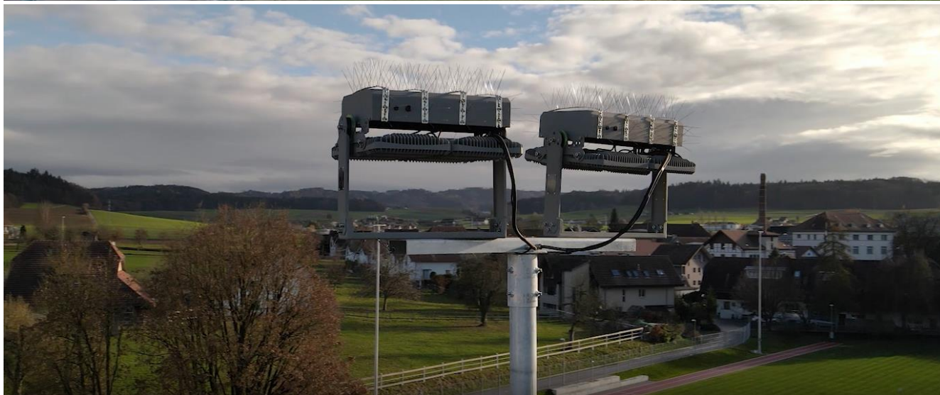
Video „Masten stellen mit Helikopter“